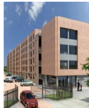
Edificio residencial La Belleza, Vivienda de interés prioritario, Diseño eléctrico, hidrosanitario, iluminación y comunicaciones.