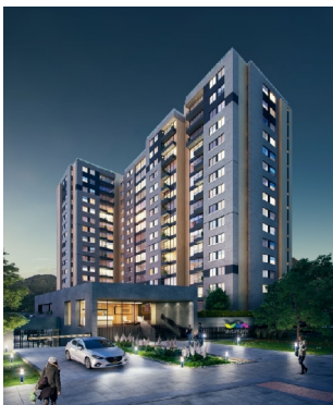
Edificio Residencial Vista Mayor – Bogotá, D.C. Revisión de diseños de los sistemas: eléctrico, comunicaciones, hidrosanitario, red contra incendio y red de gas.