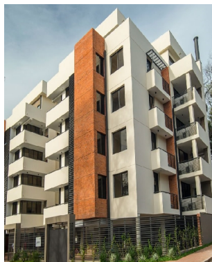
Edificio residencial Charles, Diseño eléctrico, seguridad electrónica, iluminación y comunicaciones.