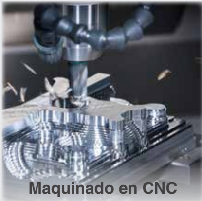
Maquinado en CNC