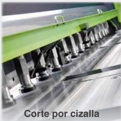
Corte por cizalla