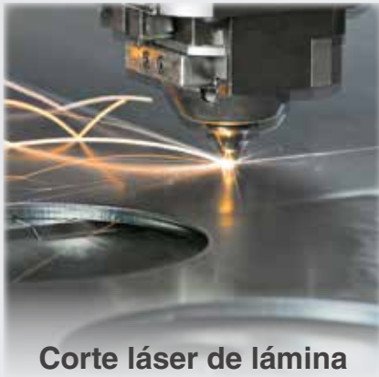
Corte láser de lámina

Somos una empresa con más de 40 años en el mercado, contamos con un centro de servicios metalmecánicos de alta tecnología que nos permite garantizar las exigencias técnicas de nuestros servicios.