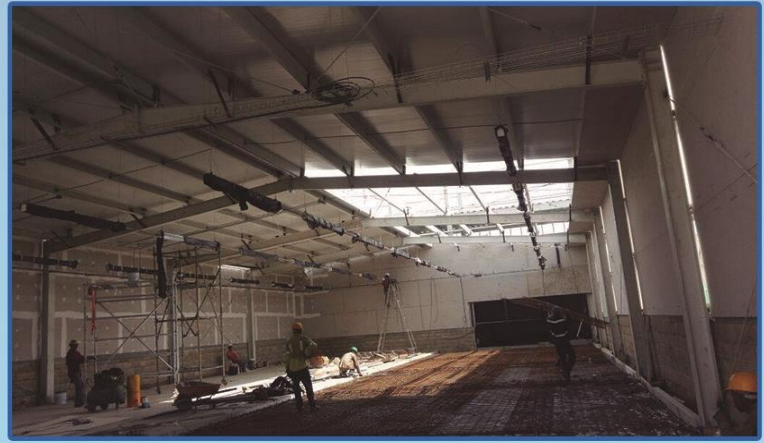
Tienda Ara la Gloria - Proyecto ejecutado en la ciudad de Montería. Cliente JMV.