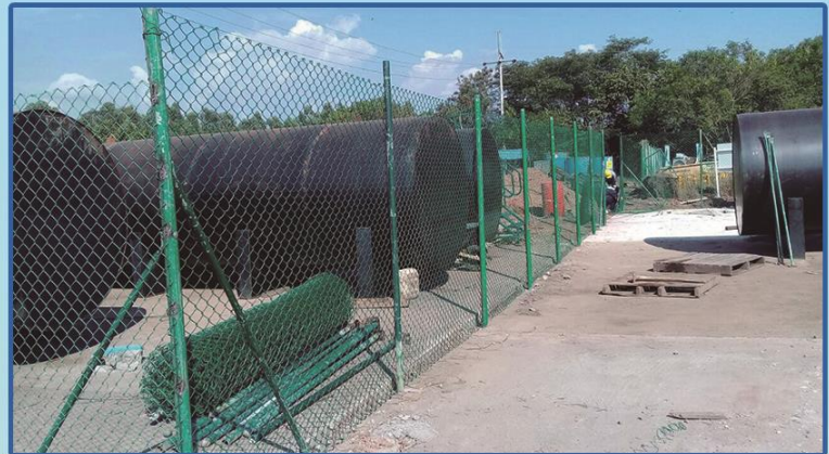
Proyecto de obras civiles EPSA. Ejecutado en la mina el Hatillo. Cliente EPSA Excavaciones de Colombia.