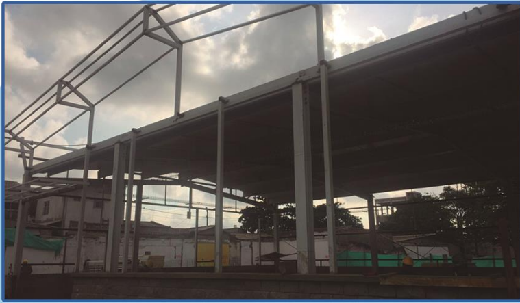
Tienda Ara San salvador - Proyecto ejecutado en la ciudad de Barranquilla. Cliente JMV.