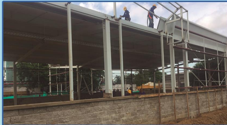
Tienda Ara Bavel - Proyecto ejecutado en la ciudad de Sincelejo. Cliente Termopainel de Colombia.