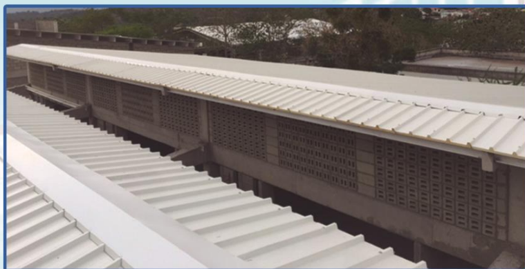
Proyecto Institucion Educativa Ariguaní - Proyecto ejecutado en el municipio de Plato Magdalena. Cliente Mota Engil Colombia.