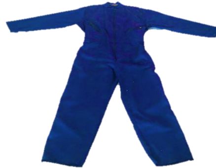
OVEROL DRIL VULCANO

Ajuste rápido con ratchet, protección que se ajusta a la cabeza para protegerla de acuerdo a su clasificación, ya sea contra impactos, partículas proyectadas, tensión eléctrica o una combinación de estos. Casco con 4 puntos de apoyo.