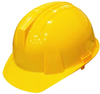
CASCO DE SEGURIDAD BUNKER

Ajuste rápido con ratchet, protección que se ajusta a la cabeza para protegerla de acuerdo a su clasificación, ya sea contra impactos, partículas proyectadas, tensión eléctrica o una combinación de estos. Casco con 4 puntos de apoyo.