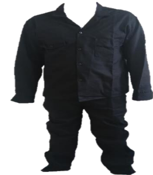
OVEROL DRIL VULCANO

Overol enterizo manga larga, Tallas S=36 , M=38, L=40, XL=42, colores Azul oscuro, Negro, Beige o sobre pedido. Su uso es ideal en sectores de la construcción, minería, manufactura, automotriz.