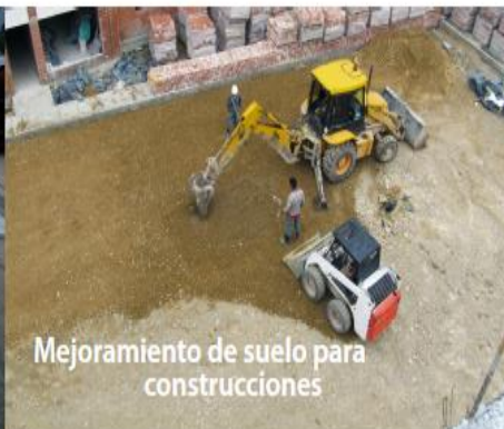
Mejoramiento de suelo para construcciones