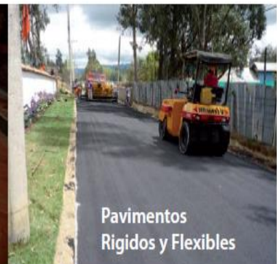
Pavimentos Rígidos y Flexibles