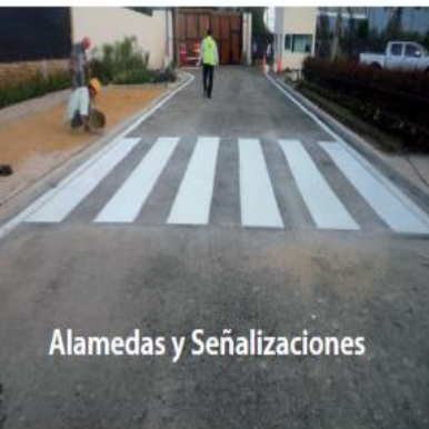
Alamedas y Señalizaciones