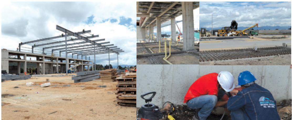
Suministro y mano de obra para la construcción de redes hidráulicas, sanitarias y red contra incendios del Terminal Logístico de Colombia - Bogotá.