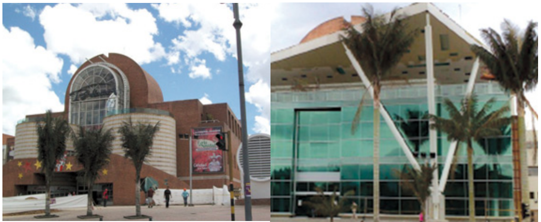
Instalación de redes hidrosanitarias, gas y contra incendios