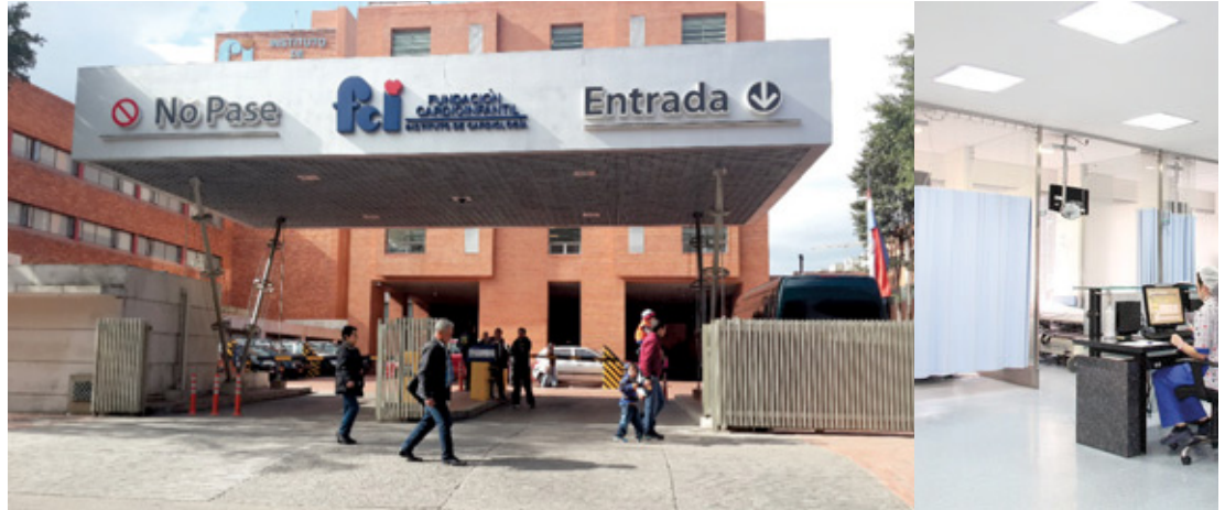
Torre de hospitalización - Instalación de redes hidrosanitarias, gas y contra incendios.