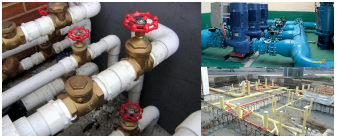
Sistemas de bombeo para aguas residuales, suministro instalación y adecuación de redes, asistencia técnica

Bogotá - Cll 86 No. 102 - 61 Int. 3 Apt. 313 - Teléfono: (57 1) 302 2955 Celular: 300 888 6046 - E-mail: comercial@ingeconssas.com.co Villavicencio - Cra 13 Este No. 36 - 231 Casa 115 - Tel: (57 8) 673 6066 Celular: 310 244 2725 - E-mail: proyectos@ingeconssas.com.co www.ingeconssas.com.co