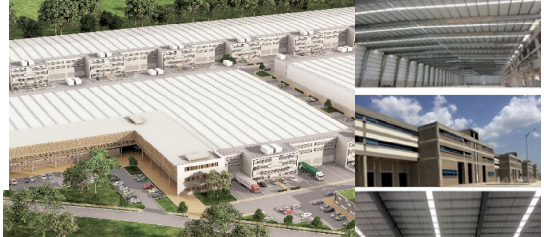
Suministro y mano de obra para la construcción de redes hidrosanitarias y red contra incendios del Terminal Logístico de Cartagena.