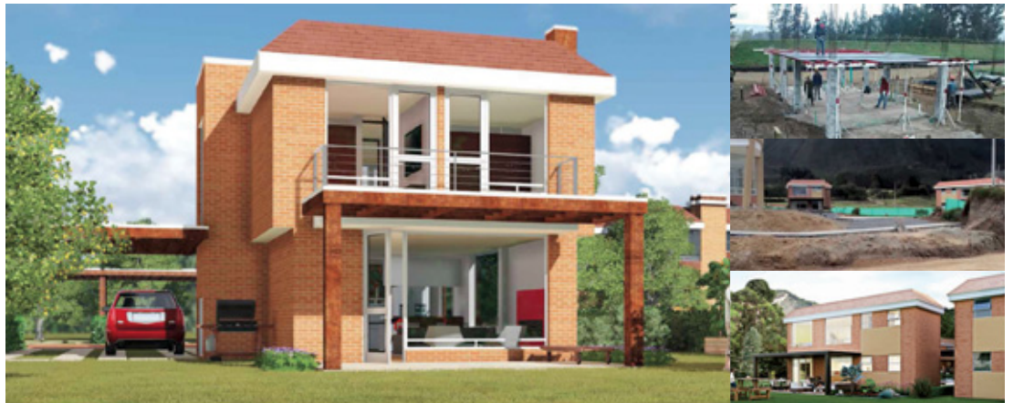
Cliente: Construimos con propiedad S.A. - Suministro y mano de obra para instalaciones hidrosanitarias Suministro y mano de obra para instalaciones de red de gas natural - instalaciones hidráulicas